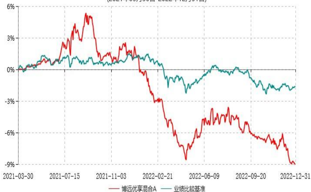
博远优享混合C累计净值增长率与业绩比较基准收益率历史走势对比图