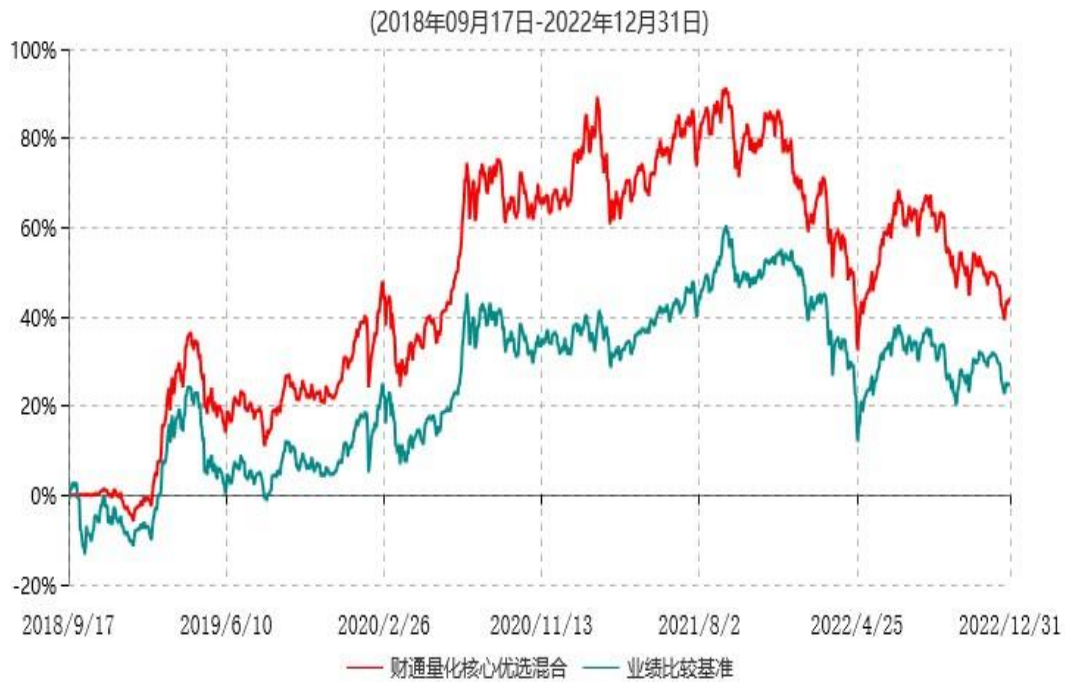
财通量化核心优选混合型证券投资基金累计净值增长率与业绩比较基准收益率历史走势对比图