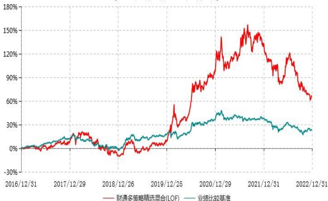
财通多策略精选混合型证券投资基金(LOF)累计净值增长率与业绩比较基准收益率历史走势对比图 (2016年12月31日-2022年12月31日)