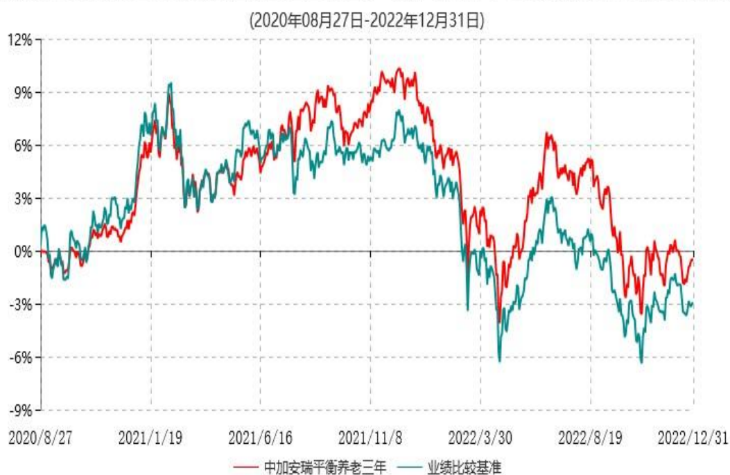
中加安瑞平衡养老目标三年持有期混合型发起式基金中基金(FOF)累计净值增长率与业绩比较基准收益率历史走势对比图