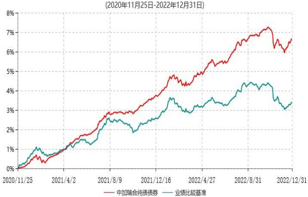
中加瑞合纯债债券型证券投资基金累计净值增长率与业绩比较基准收益率历史走势对比图