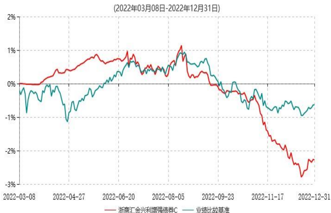
浙商汇金兴利增强债券C累计净值增长率与业绩比较基准收益率历史走势对比图

注;本基金合同生效日为2022年3月8日,自基金合同生效日起至本报告期末不满一年。至本报告期末,本基金已完成建仓。建仓期为2022年3月8日-2022年9月7日,但报告期末距建仓结束不满一年,建仓期结束时各项资产配置比例符合合同约定。