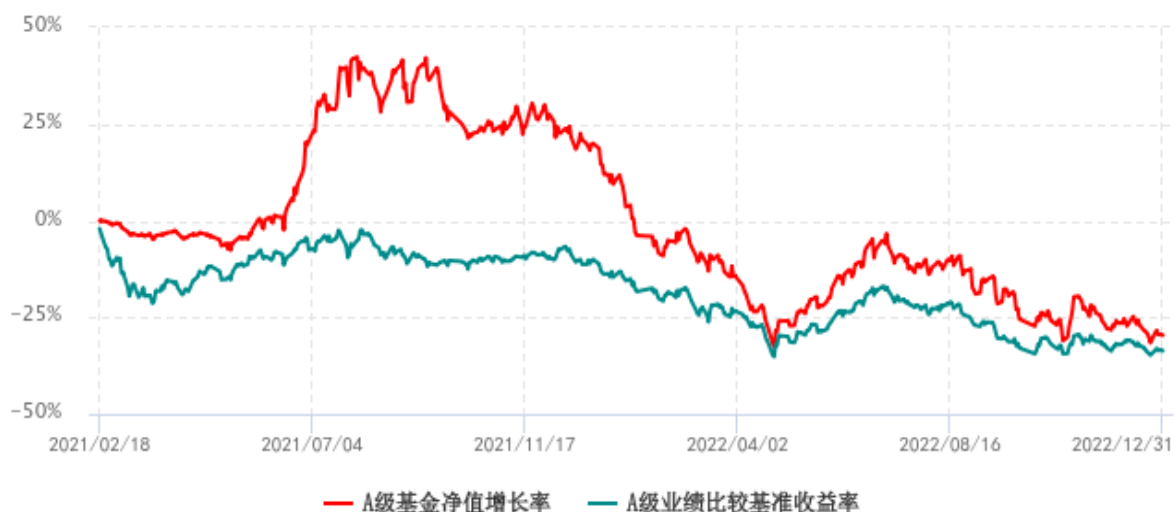
A级基金份额累计净值增长率与同期业绩比较基准收益率历史走势对比图 (2021年02月18日-2022年12月31日)