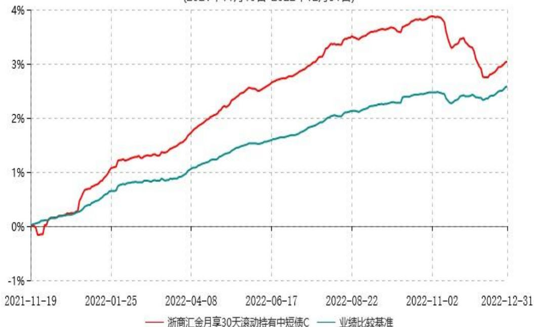
浙商汇金月享30天滚动持有中短债C累计净值增长率与业绩比较基准收益率历史走势对比图 (2021年11月19日-2022年12月31日)

注：本基金合同生效日为2021年11月19日。至本报告期末，本基金已完成建仓。建仓期为2021年11月19日-2022年5月18日，但报告期末距建仓结束不满一年，建仓期结束时各项资产配置比例符合合同约定。