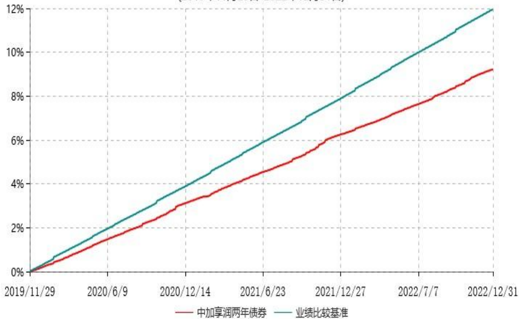
中加享润两年定期开放债券型证券投资基金累计净值增长率与业绩比较基准收益率历史走势对比图 (2019年11月29日-2022年12月31日)