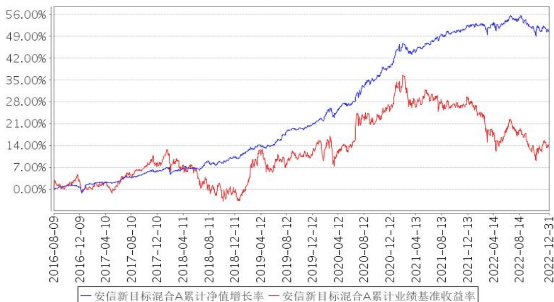
安信新目标混合A累计净值增长率与同期业绩比较基准收益率的历史走势对比图