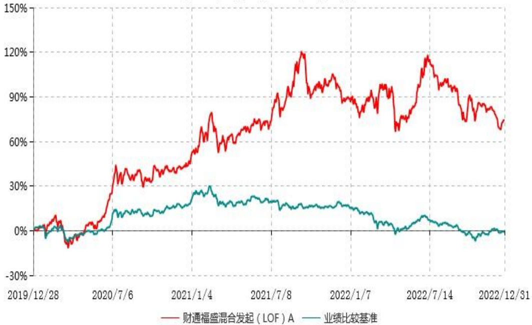
财通福盛混合发起（LOF）A累计净值增长率与业绩比较基准收益率历史走势对比图 (2019年12月28日-2022年12月31日)