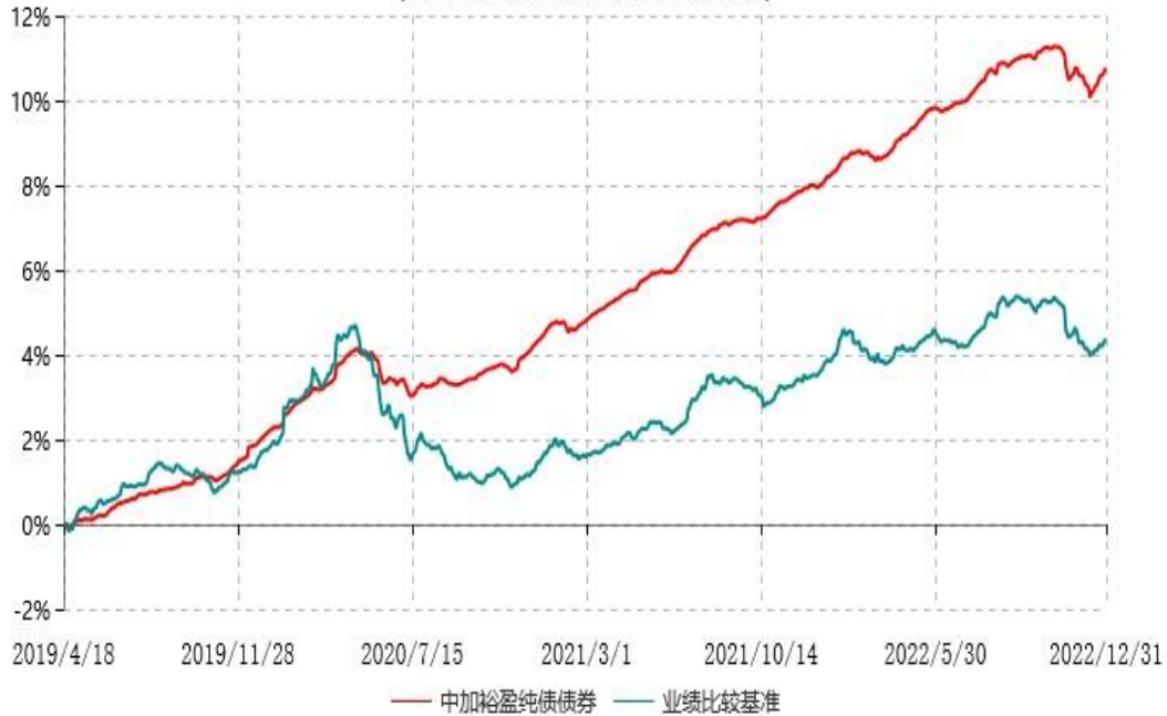
中加裕盈纯债债券型证券投资基金累计净值增长率与业绩比较基准收益率历史走势对比图 (2019年04月18日-2022年12月31日)