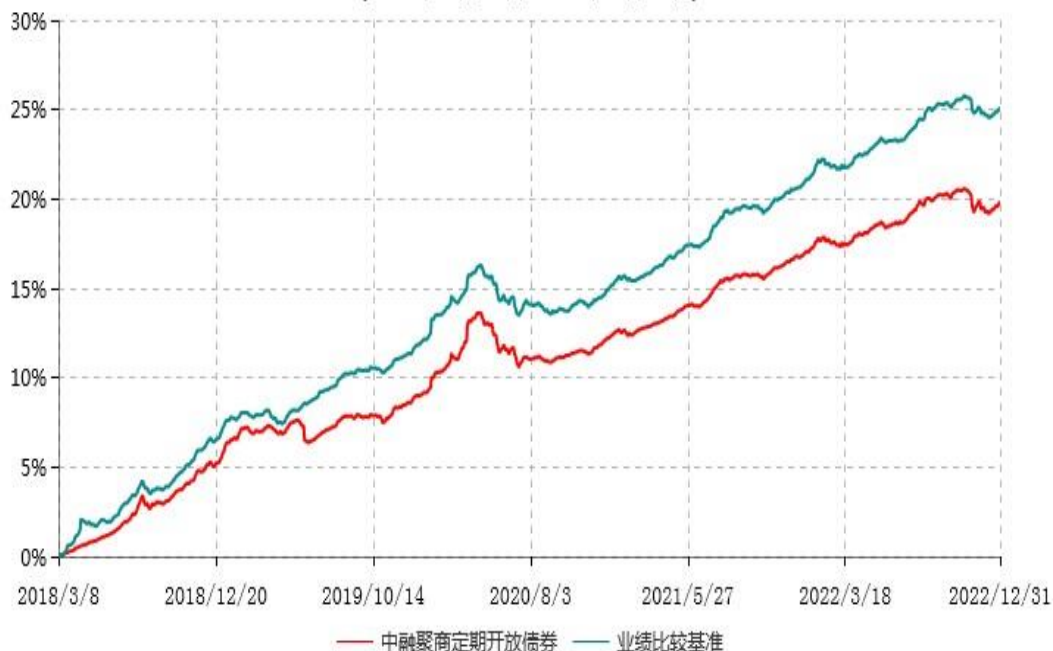
中融聚商3个月定期开放债券型发起式证券投资基金累计净值增长率与业绩比较基准收益率历史走势对比图 (2018年03月08日-2022年12月31日)

注：按基金合同和招募说明书的约定，本基金自基金合同生效日起6个月内为建仓期，建仓期结束时本基金的各项投资比例符合基金合同的有关约定。