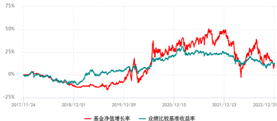
基金份额累计净值增长率与同期业绩比较基准收益率历史走势对比图 (2017年11月24日-2022年12月31日)

注：1、本基金成立于 2017 年 11 月 24 日；2、比较基准为沪深 300 指数收益率×50%+中证综合债指数收益率×50%。