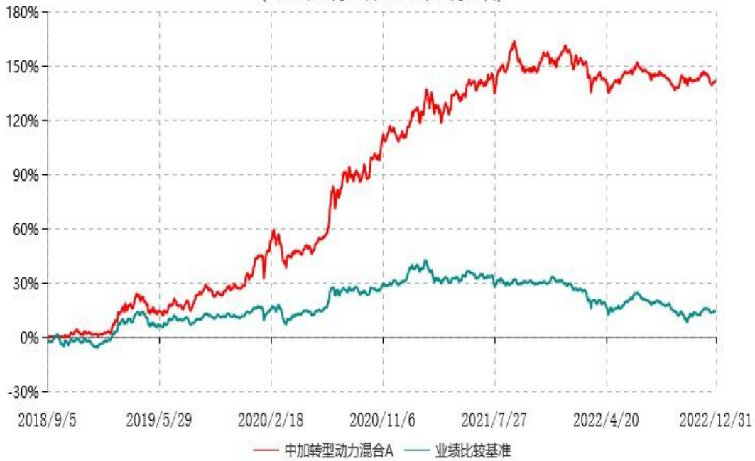
中加转型动力混合C累计净值增长率与业绩比较基准收益率历史走势对比图