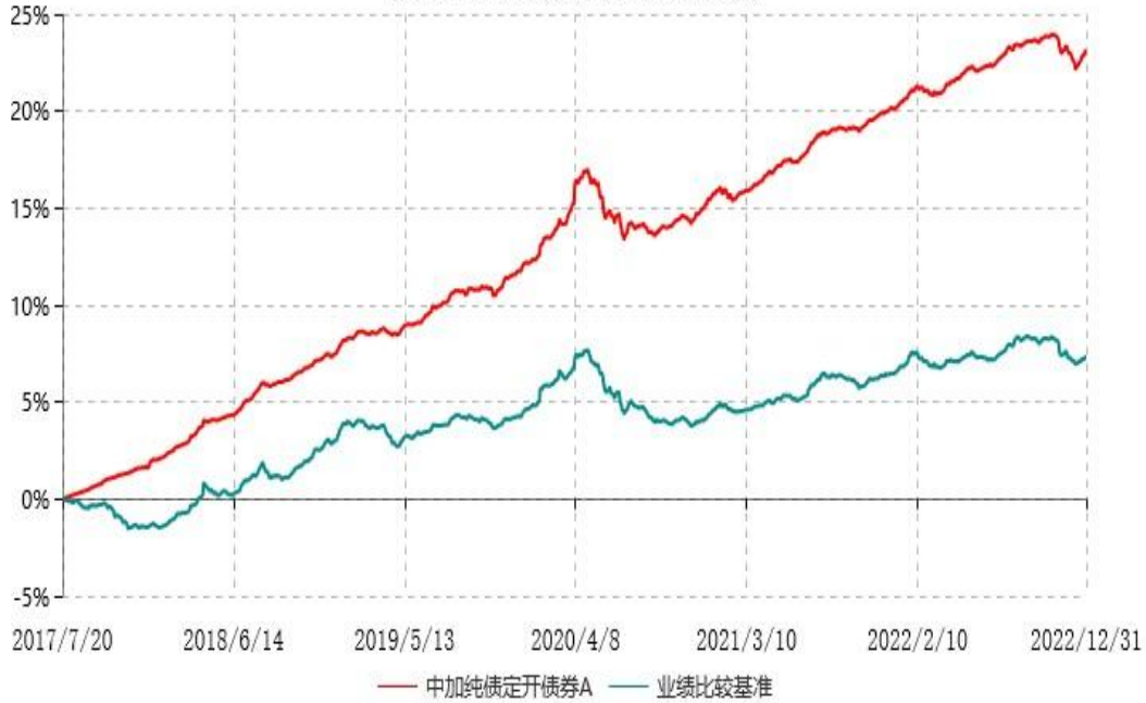
中加纯债定开债券A累计净值增长率与业绩比较基准收益率历史走势对比图 (2017年07月20日-2022年12月31日)