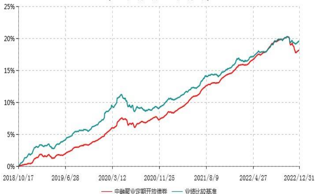
中融聚业3个月定期开放债券型发起式证券投资基金累计净值增长率与业绩比较基准收益率历史走势对比图 (2018年10月17日-2022年12月31日)

注：按基金合同和招募说明书的约定，本基金自基金合同生效日起6个月内为建仓期，建仓期结束时本基金的各项投资比例符合基金合同的有关约定。