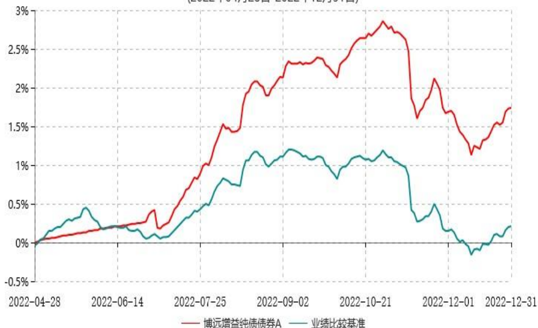
博远增益纯债债券A累计净值增长率与业绩比较基准收益率历史走势对比图 (2022年04月28日-2022年12月31日)