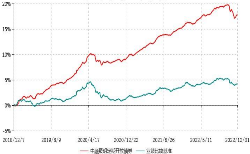
中融聚明3个月定期开放债券型发起式证券投资基金累计净值增长率与业绩比较基准收益率历史走势对比图 (2018年12月07日-2022年12月31日)

注：按基金合同和招募说明书的约定，本基金自基金合同生效日起6个月内为建仓期，建仓期结束时本基金的各项投资比例符合基金合同的有关约定。