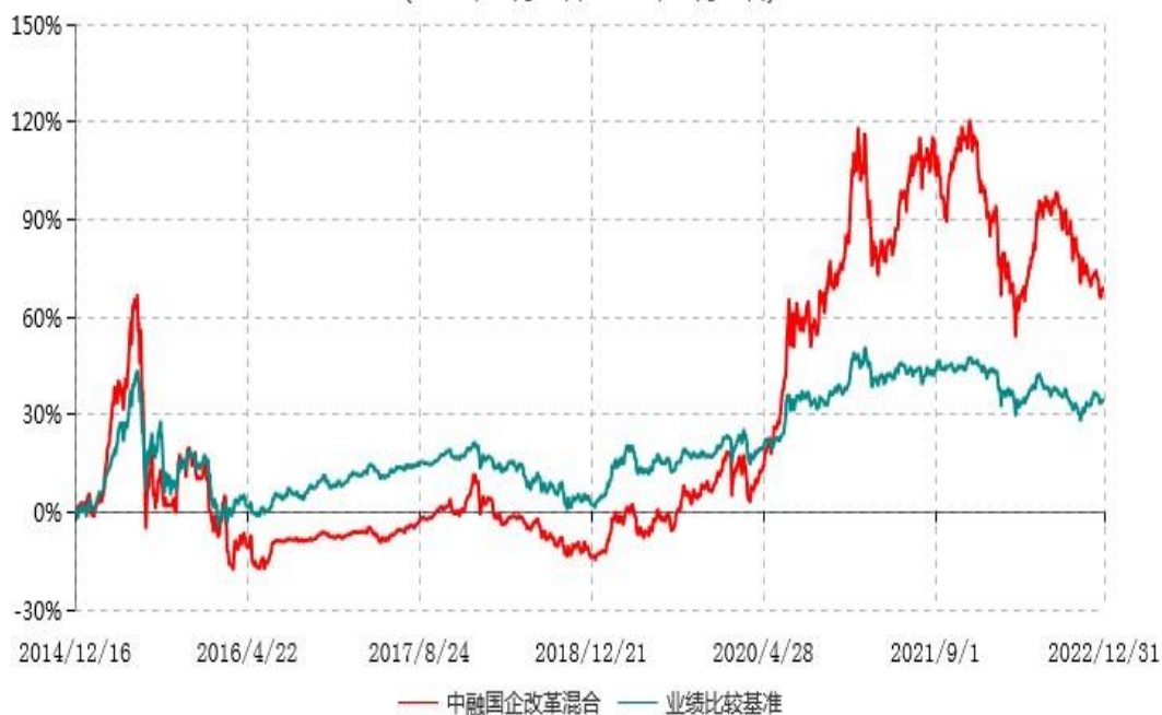
中融国企改革灵活配置混合型证券投资基金累计净值增长率与业绩比较基准收益率历史走势对比图 (2014年12月16日-2022年12月31日)

注：按基金合同和招募说明书的约定，本基金自基金合同生效日起6个月内为建仓期，建仓期结束时本基金的各项投资比例符合基金合同的有关约定。