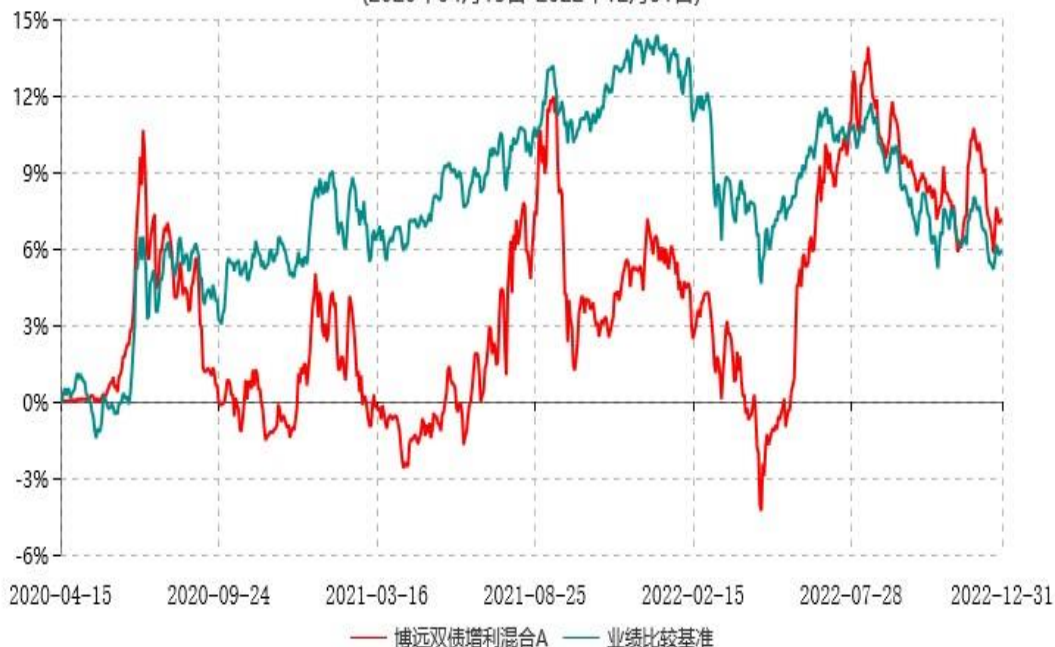
博远双债增利混合C累计净值增长率与业绩比较基准收益率历史走势对比图