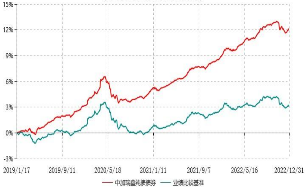
中加瑞鑫纯债债券型证券投资基金累计净值增长率与业绩比较基准收益率历史走势对比图 (2019年01月17日-2022年12月31日)