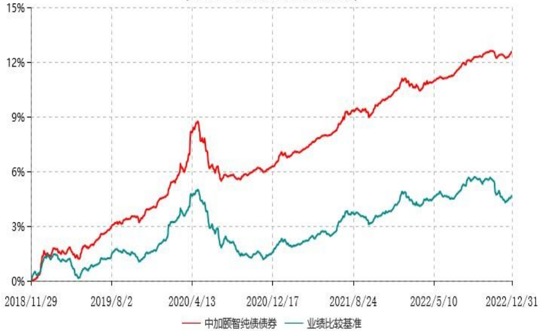
中加颐智纯债债券型证券投资基金累计净值增长率与业绩比较基准收益率历史走势对比图 (2018年11月29日-2022年12月31日)