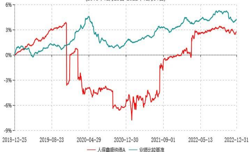
人保鑫盛纯债C累计净值增长率与业绩比较基准收益率历史走势对比图