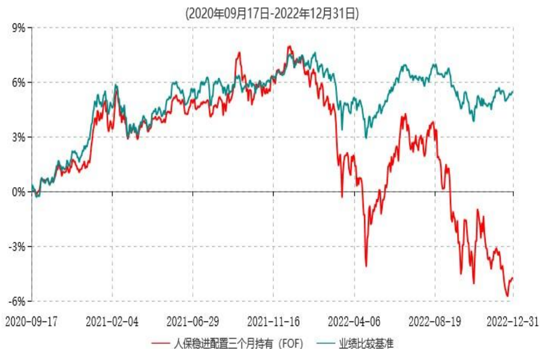
人保稳进配置三个月持有期混合型基金中基金(FOF)累计净值增长率与业绩比较基准收益率历史走势对比图

注：1、本基金基金合同于2020年09月17日生效。根据基金合同规定，本基金建仓期为6个月，建仓期结束，本基金的各项投资比例符合基金合同的有关约定。