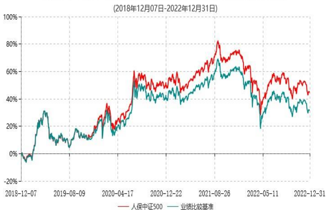
人保中证500指数型证券投资基金累计净值增长率与业绩比较基准收益率历史走势对比图

注：1、本基金基金合同于2018年12月7日生效。根据基金合同规定，本基金建仓期为6个月，建仓期满，本基金的各项投资比例符合基金合同的有关约定。