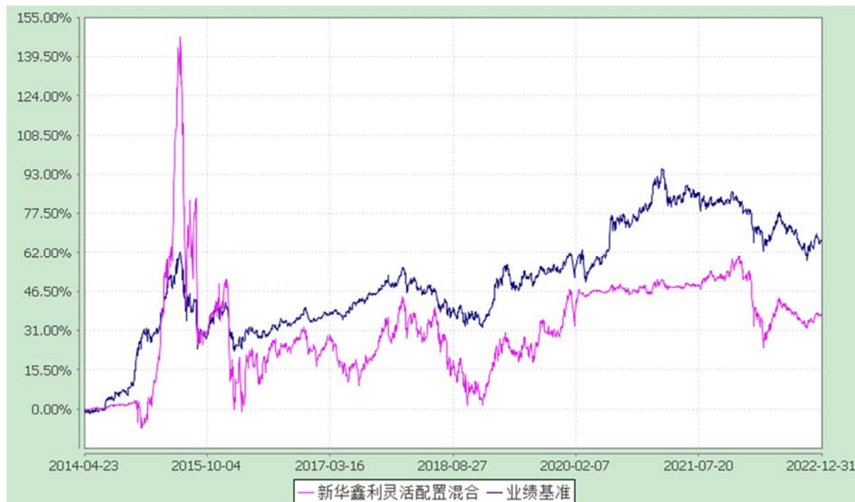
自基金合同生效以来份额累计净值增长率与业绩比较基准收益率的历史走势对比图 (2014 年 4 月 23 日至 2022 年 12 月 31 日)