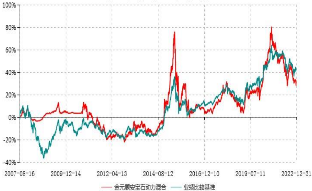
金元顺安宝石动力混合型证券投资基金累计净值增长率与业绩比较基准收益率历史走势对比图 (2010年10月01日-2022年12月31日)