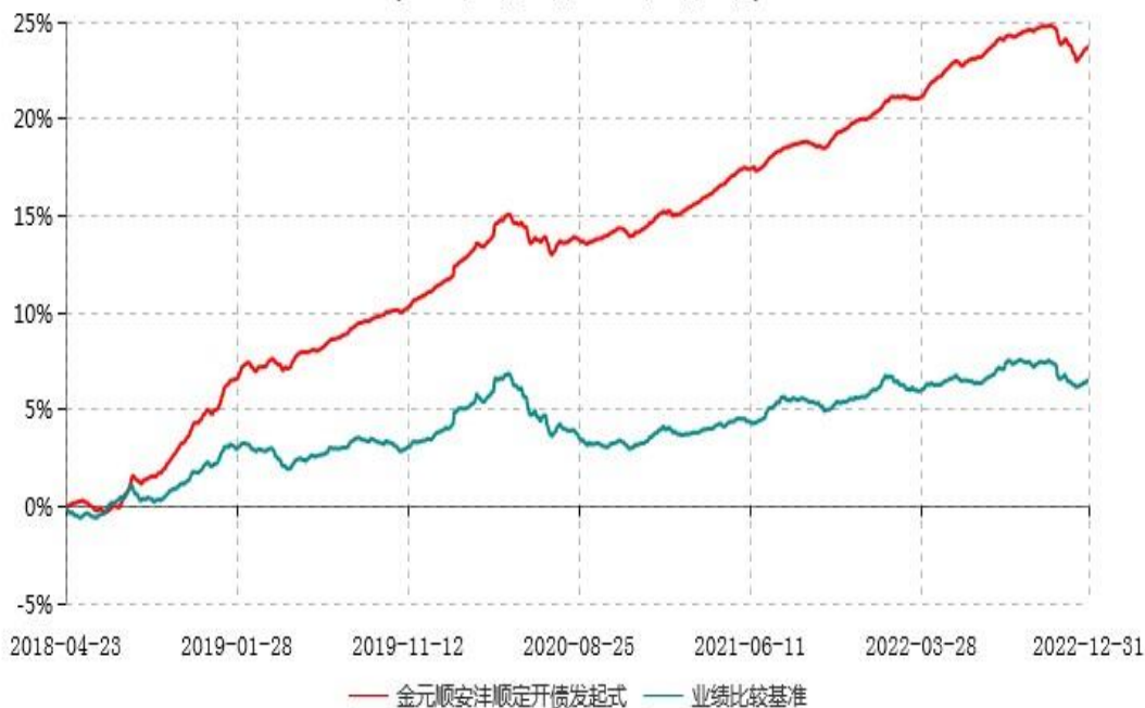
金元顺安沅顺定期开放债券型发起式证券投资基金累计净值增长率与业绩比较基准收益率历史走势对比图 (2018年04月23日-2022年12月31日)