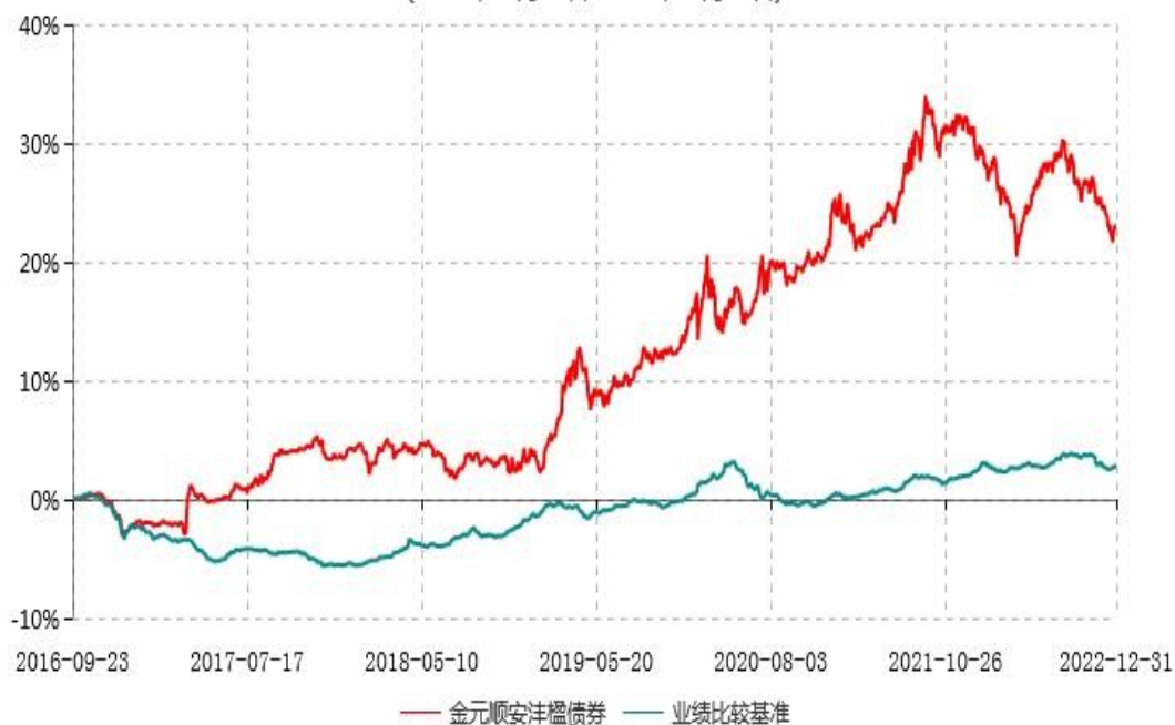
金元顺安沅楹债券型证券投资基金累计净值增长率与业绩比较基准收益率历史走势对比图 (2016年09月22日-2022年12月31日)