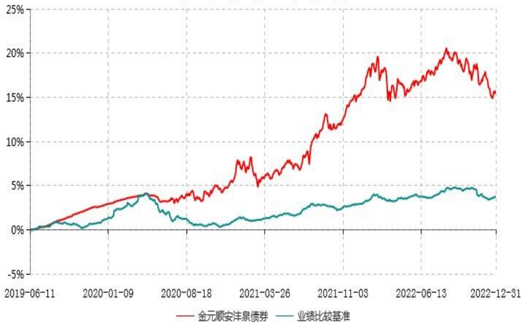
金元顺安沅泉债券型证券投资基金累计净值增长率与业绩比较基准收益率历史走势对比图 (2019年06月10日-2022年12月31日)