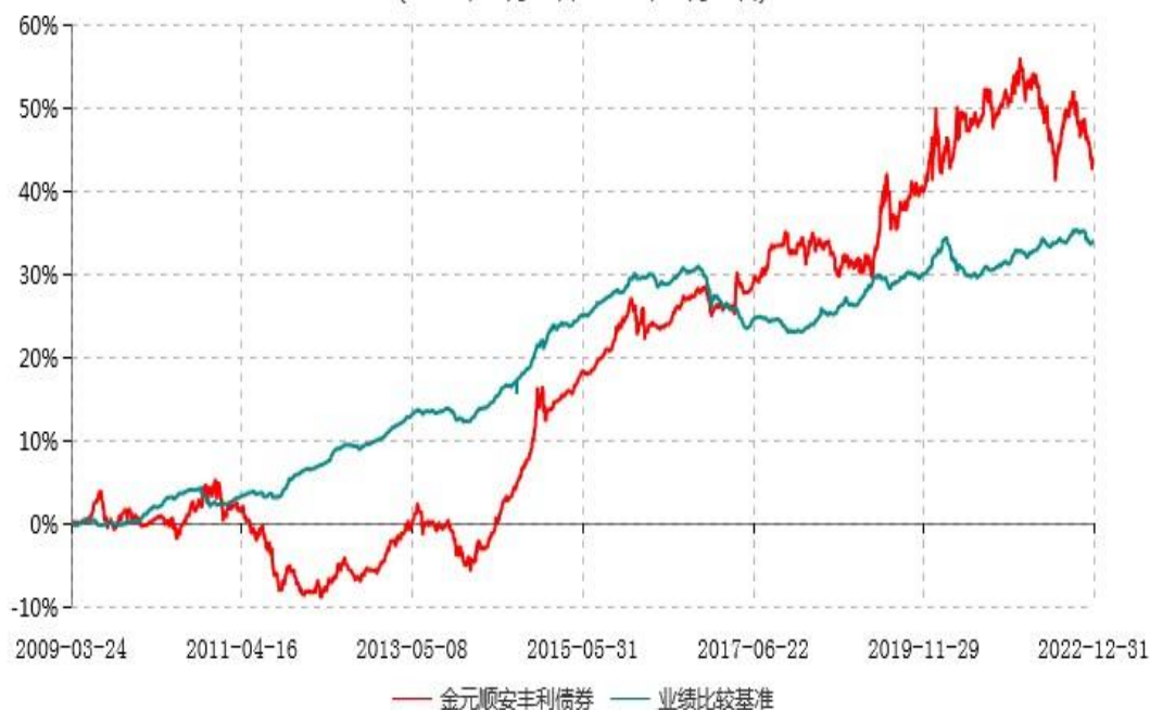
金元顺安丰利债券型证券投资基金累计净值增长率与业绩比较基准收益率历史走势对比图 (2009年03月23日-2022年12月31日)