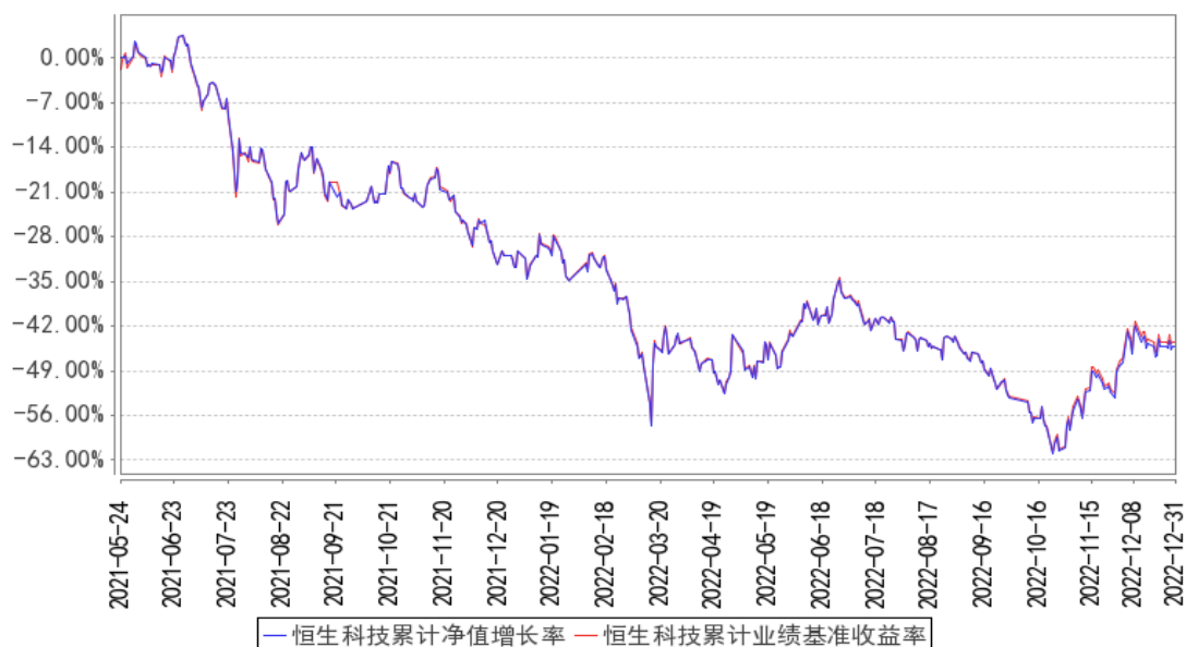
恒生科技累计净值增长率与同期业绩比较基准收益率的历史走势对比图

注：图示日期为 2021 年 5 月 24 日至 2022 年 12 月 31 日。