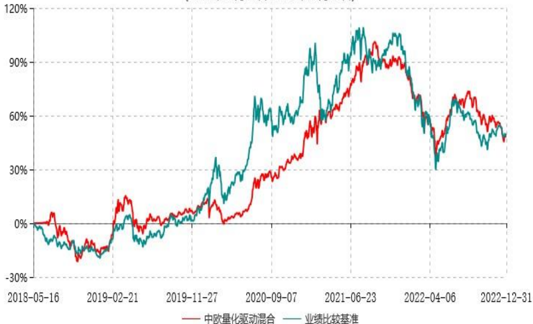
中欧量化驱动混合型证券投资基金累计净值增长率与业绩比较基准收益率历史走势对比图 (2018年05月16日-2022年12月31日)

注：2019年4月26日，组合业绩比较基准变更为创业板指数收益率*95%+中债综合指数收益率*5%。2022年8月11日，业绩比较基准变更为中证全指指数收益率*80%+银行活期存款利率(税后)*15%+中证港股通综合指数(人民币)收益率*5%。