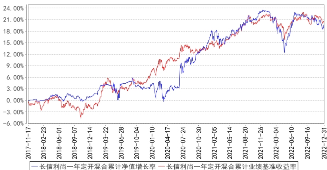
长信利尚一年定开混合累计净值增长率与同期业绩比较基准收益率的历史走势对比图

注：1、图示日期为 2017 年 11 月 17 日至 2022 年 12 月 31 日。