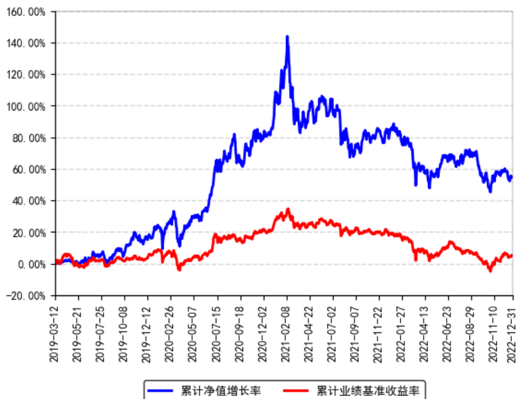
南方智诚混合累计净值增长率与同期业绩比较基准收益率的历史走势对比图