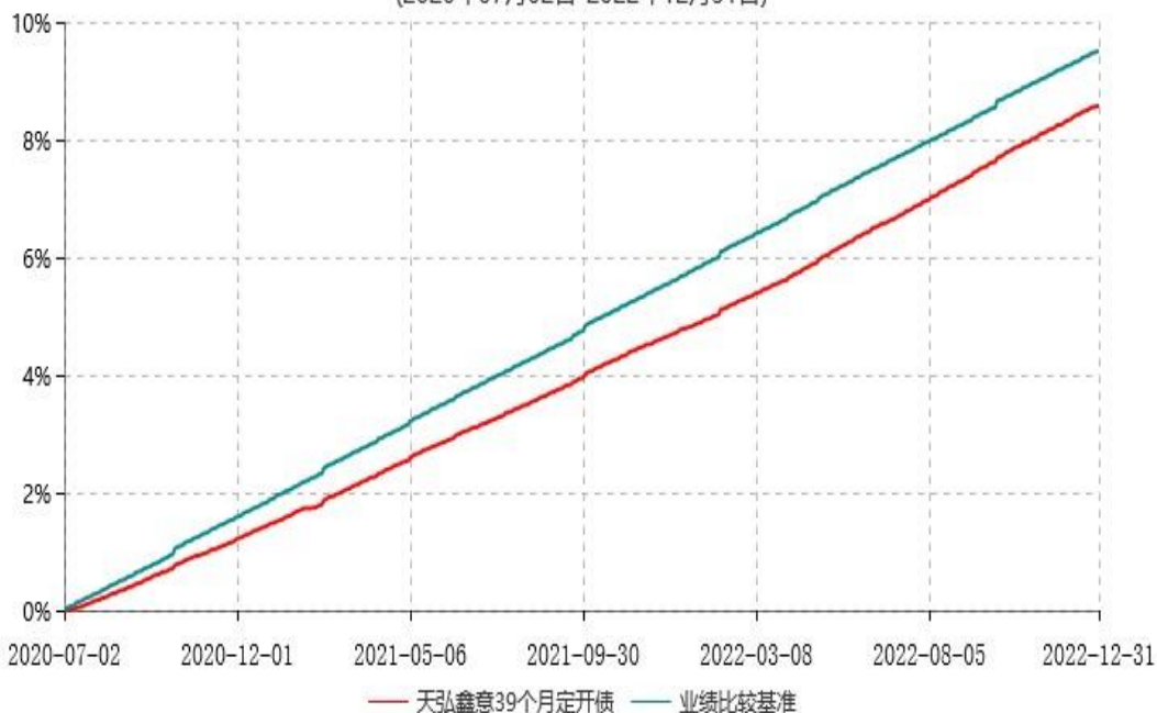
天弘鑫意39个月定期开放债券型证券投资基金累计净值增长率与业绩比较基准收益率历史走势对比图 (2020年07月02日-2022年12月31日)

注：1、本基金合同于2020年07月02日生效。 2、本报告期内，本基金的各项投资比例达到基金合同约定的各项比例要求。