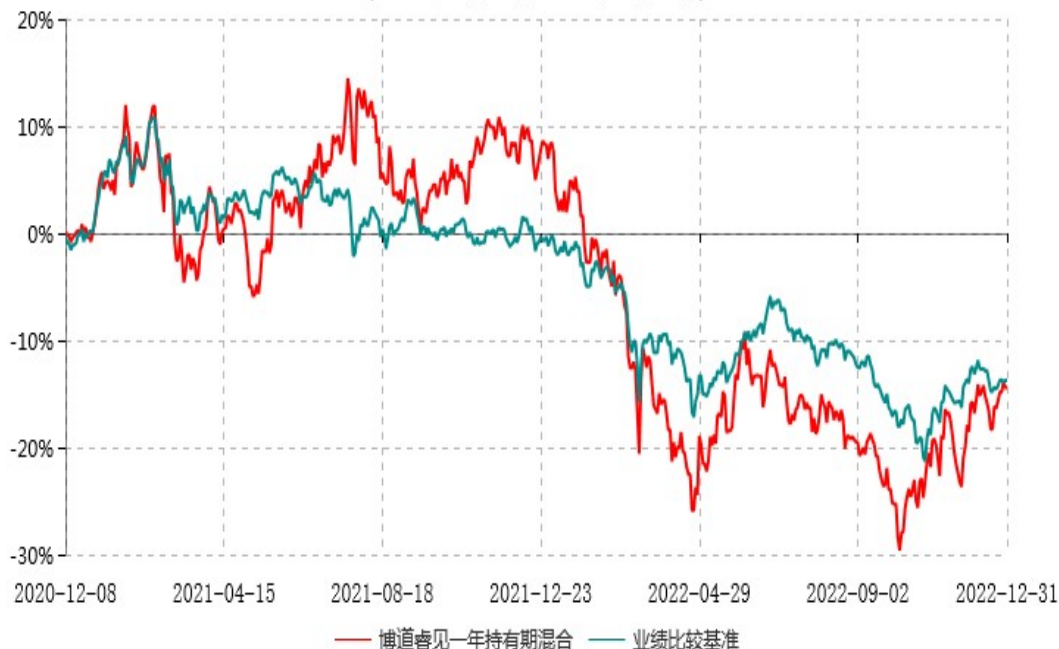
博道睿见一年持有期混合型证券投资基金累计净值增长率与业绩比较基准收益率历史走势对比图 (2020年12月08日-2022年12月31日)

注：本基金建仓期为自基金合同生效日起的6个月。截至建仓期结束，本基金各项资产配置比例符合基金合同及招募说明书有关投资比例的约定。