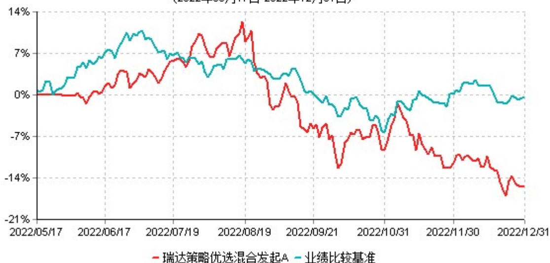
瑞达策略优选混合发起A累计净值增长率与业绩比较基准收益率历史走势对比图 (2022年05月17日-2022年12月31日)