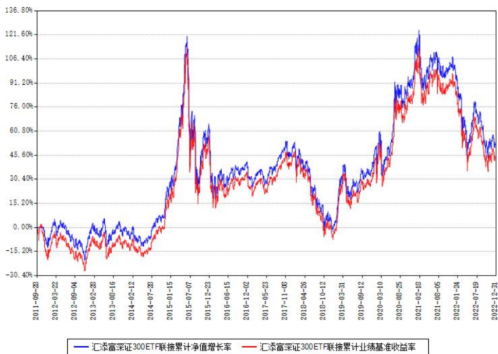
汇添富深证300ETF联接累计净值增长率与同期业绩基准收益率对比图

注：本基金建仓期为本《基金合同》生效之日（2011年09月28日）起6个月，建仓期结束时各项资产配置比例符合合同约定。