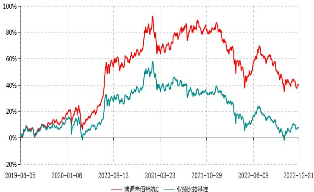
博道叁佰智航C累计净值增长率与业绩比较基准收益率历史走势对比图 (2019年06月05日-2022年12月31日)

注：本基金建仓期为自基金合同生效日起的6个月。截至建仓期结束，本基金各项资产配置比例符合基金合同及招募说明书有关投资比例的约定。