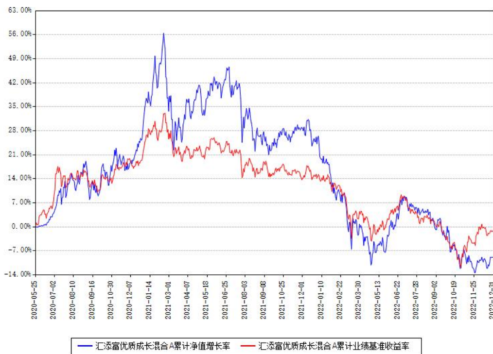
汇添富优质成长混合A累计净值增长率与同期业绩基准收益率对比图