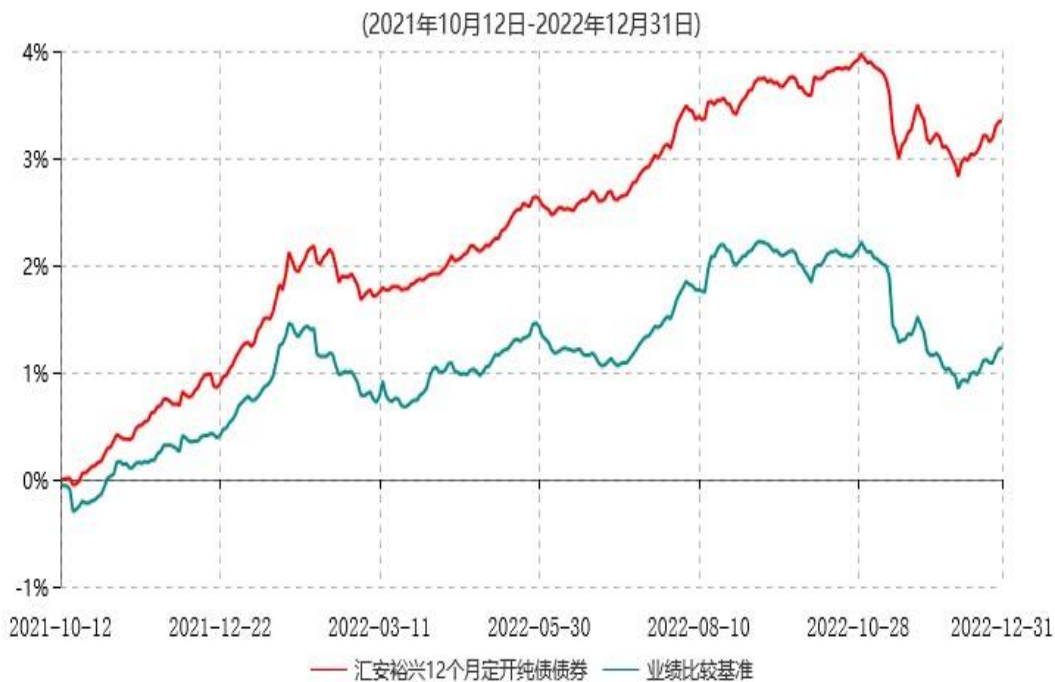
汇安裕兴12个月定期开放纯债债券型发起式证券投资基金累计净值增长率与业绩比较基准收益率历史走势对比图

注：①基金合同生效日为2021年10月12日，至本报告期末，本基金合同生效已满一年。