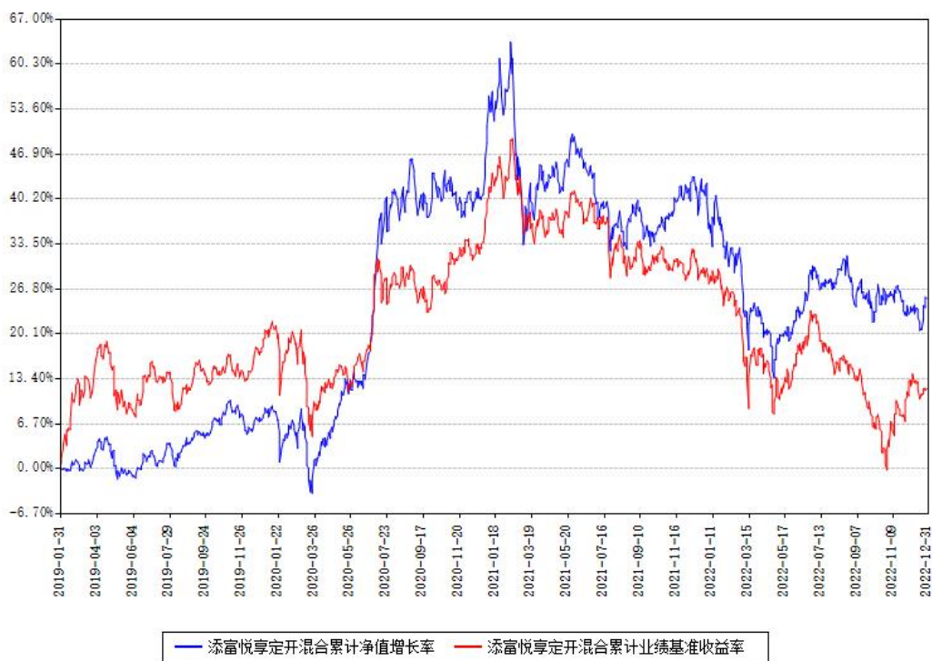
添富悦享定开混合累计净值增长率与同期业绩基准收益率对比图

注：本基金建仓期为本《基金合同》生效之日（2019年01月31日）起6个月，建仓期结束时各项资产配置比例符合合同约定。