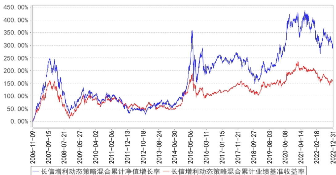
长信增利动态策略混合累计净值增长率与同期业绩比较基准收益率的历史走势对比图

注：1、图示日期为 2006 年 11 月 9 日至 2022 年 12 月 31 日。