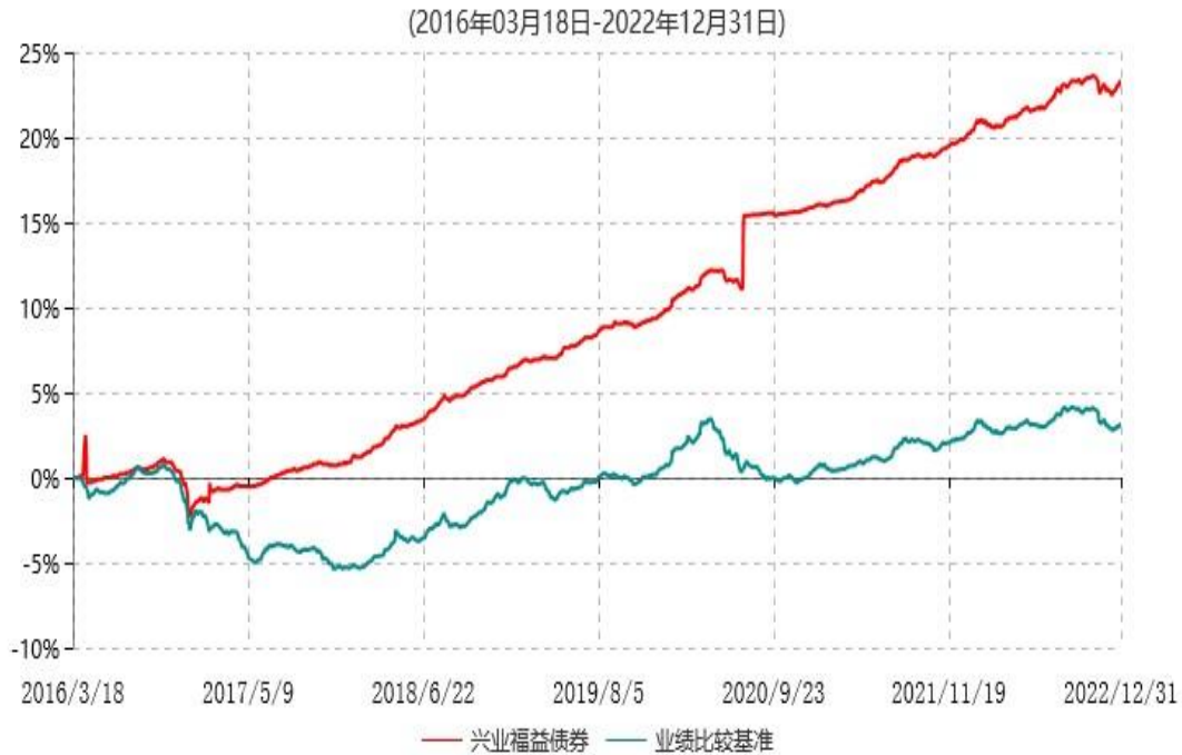
兴业福益债券型证券投资基金累计净值增长率与业绩比较基准收益率历史走势对比图