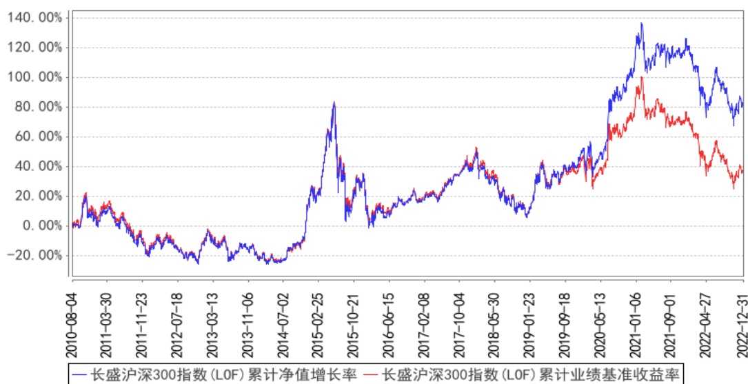
长盛沪深300指数(LOF)累计净值增长率与同期业绩比较基准收益率的历史走势对比图

注：按照本基金合同规定，本基金管理人应当自基金合同生效之日起三个月内使基金的投资组合