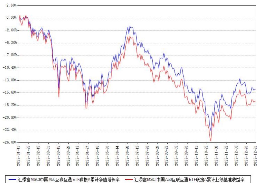
汇添富MSCI中国A50互联互通ETF联接C累计净值增长率与同期业绩基准收益率对比图