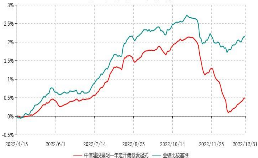
中信建投景明一年定期开放债券型发起式证券投资基金累计净值增长率与业绩比较基准收益率历史走势对比图 (2022年04月15日-2022年12月31日)

注：1、本基金基金合同生效于2022年4月15日，截至报告期末本基金基金合同生效未满一年。