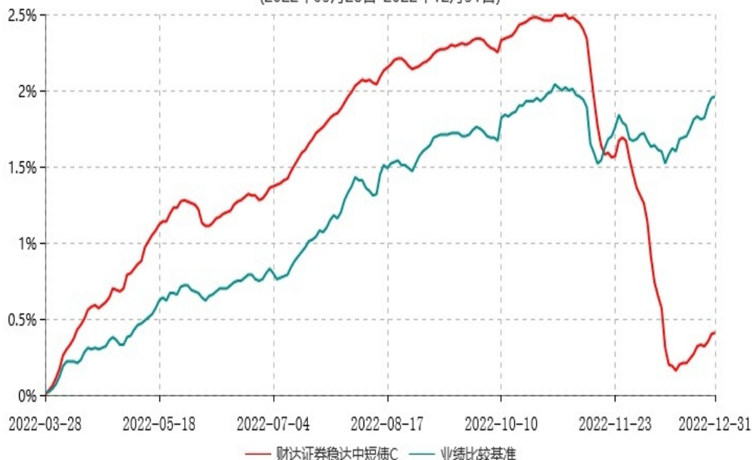
财达证券稳达中短债C累计净值增长率与业绩比较基准收益率历史走势对比图 (2022年03月28日-2022年12月31日)

2022年3月28日，财达证券稳达一号集合资产管理计划正式变更为财达证券稳达中短债债券型集合资产管理计划，即本集合计划。